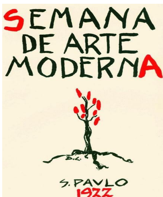
Fonte: Cartaz de divulgação da Semana de Arte Moderna Le Monde Diplomatique Brasil.

27. A Semana de Arte Moderna de 1922 foi um evento que marcou a História do Brasil, com ações que envolveram vários setores da sociedade. Abaixo podemos observar o cartaz do encontro e uma obra de Tarsila do Amaral, uma das principais representantes do modernismo.